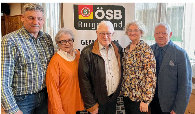
Das Organisationskomitee freut sich auf zahlreiche Teilnehmer.

Wir freuen uns wieder auf zahlreiche Teilnehmer!